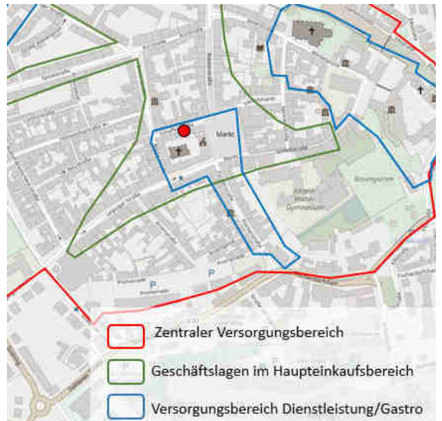
© OpenStreetMap-Mitwirkende / Quelle: Einzelhandels- und Zentrenkonzept für die Große Kreisstadt Torgau, BBE 2016)