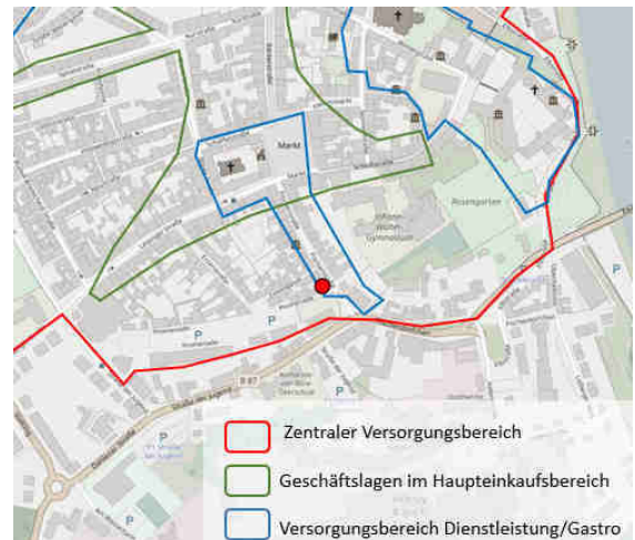
© OpenStreetMap-Mitwirkende / Quelle: Einzelhandels- und Zentrenkonzept für die Große Kreisstadt Torgau, BBE 2016)