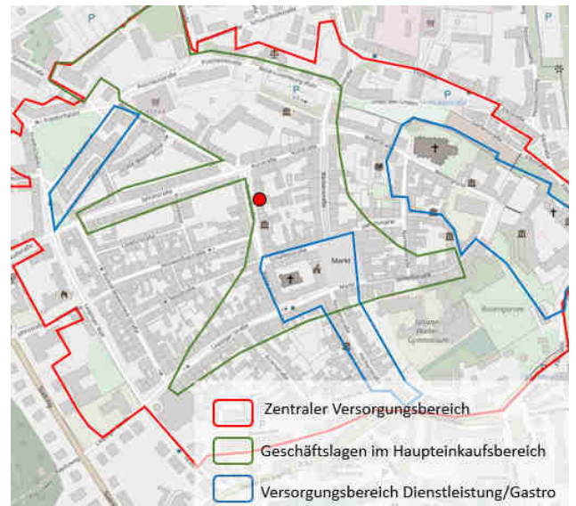
© OpenStreetMap-Mitwirkende / Quelle: Einzelhandels- und Zentrenkonzept für die Große Kreisstadt Torgau, BBE 2016)