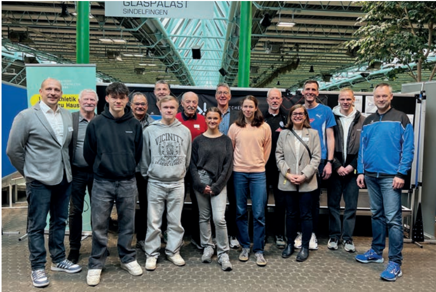
Die sportliche Torgauer Abordnung mit Vertretern der Partnerstadt Sindelfingen im Glaspalast.

SSV 1952 Torgau war mit einer Abordnung bei den Deutschen Meisterschaften am Start