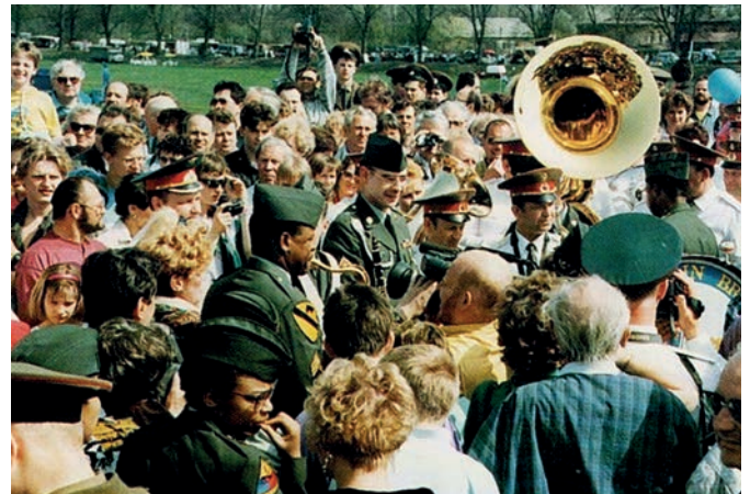
Frieden als Normalität! Amerikanische und russische Militär-Musiker auf der alten Elbbrücke in Torgau 1992.

Klaus Fey, Förderverein Europa Begegnungen e. V.