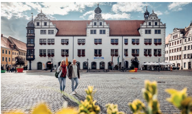
Erkundung auf dem Marktplatz vor dem historischen Rathaus in Torgau.

Entdeckerwochenende Dresden Elbland am 11. und 12. April 2026 lädt auch nach Torgau