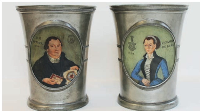
Zinnbecher mit den Porträts von Martin und Katharina Luther, um 1730 – erworben für das Museum im Jahr 2025.

Auf Initiative des 1990 gegründeten Torgauer Geschichtsvereins konnte das historisch bedeutende ehemalige Gebäude der kurfürstlichen Kanzlei saniert werden und beherbergt seit 2005 das Stadtmuseum. Die Sammlung vereint nun Bestände des Altertumsvereins Torgau, des ehemaligen Kreismuseums, der Stadt Torgau und des Torgauer Geschichtsvereins. Schwerpunkte bilden vor al-