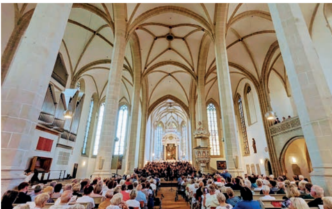
Vor drei Jahren gab es das letzte Gemeinschaftskonzert der Torgauer Chöre. Am 12. September in diesem Jahr steht es erneut auf dem Programm. Die Stadt Torgau unterstützt den Männerchor bei der Organisation, sowohl personell als auch finanziell.

Trotz knapper Kassen fördert die Stadt auch in diesem Jahr fünf lokale Projekte