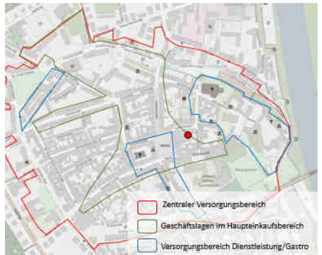
© OpenStreetMap-Mitwirkende / Quelle: Einzelhandels- und Zentrenkonzept für die Große Kreisstadt Torgau, BBE 2016)